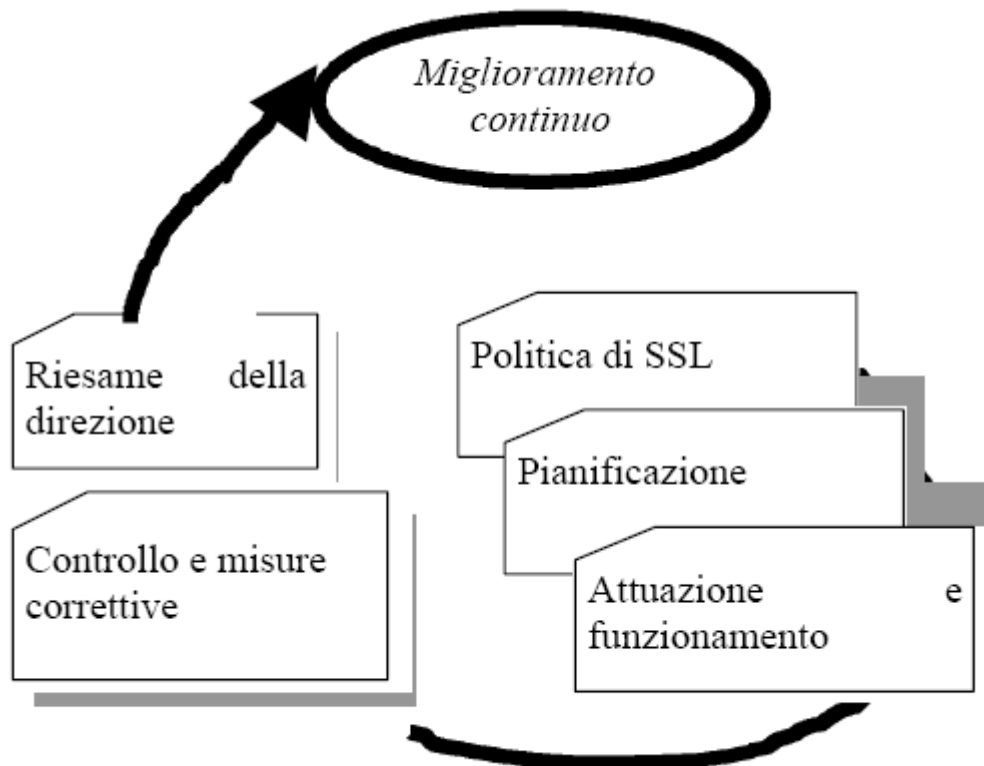
Figura 1 - Elementi per una corretta gestione della SSL

Il principio generale del Sistema di gestione qui descritto si evince dalla raffigurazione grafica seguente: